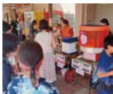
芝山100円商店街で売り