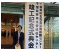
県総合医療センター竣工