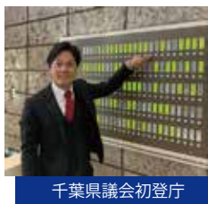
千葉県議会初登庁