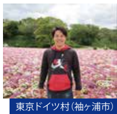
東京ドイツ村(袖ヶ浦市)

【資格など】 TOEFL(CBT)257点(TOEIC915点相当)、仏語検定3級 プロジェクトマネジメントスペシャリスト(PMS)、 政策学校「一新塾」32期生、ビール検定2級、 ふなばし市民大学学校平成26年度ボランティア学科