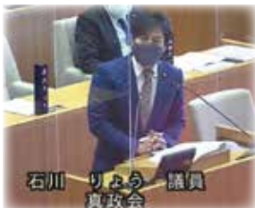
▲1定での本会議質疑の様子

法学士、開発学修士、公共経営修士、TOEFL (CBT) 257点 (TOEIC 915点相当)、仏語検定3級、プロジェクトマネジメントスペシャリスト (PMS)、政策学校「一新塾」32期生、ビール検定2級、ふなばし市民大学学校平成26年度ボランティア入門学科