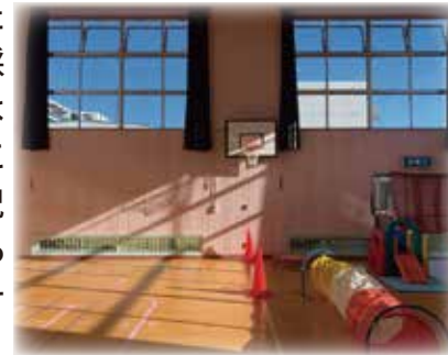
▲西船児童ホームの体育室

令和元年船橋市議会第2回定例会に、市民の方から「夏は30度を超え、冬は10度を下回る児童ホームの体育室に冷暖房を設置してください」という趣旨の陳情が提出されました。私が委員長を務める健康福祉委員会が所管となり、委員全員で児童ホームを視察し、利用者や職員の生の声を調査した結果、夏と冬の利用環境が過酷であるという実態と、エアコンが設置されている館(7館)とされていない館(14館)があり、不公平な状況が生じていることがわかりました。委員会調査を踏まえた令和元年第3回定例会にて、この陳情は全会一致で採択されました。しかし、その後の1年間、執行部の動きは鈍く、実現されてきませんでした。健康福祉委員会は、この間、何度も委員会を開き、執行部に対して、検討状況はどうなっているのか?エアコンを設置する意思はあるのか?などの聞き取り調査を行ってきました。この度、その努力が実を結ぶことになりました。順次工事をを行い、今年の夏までには全館に設置される予定です。