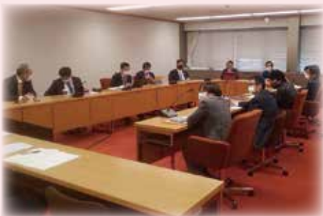
▲議員連盟の議論の様子

パートナーシップ制度とは、同性カップルなど様々な事情により法的に婚姻することができない二者に対し、パートナーであることを公的に証明する書類の交付を行うことで、社会的にも行政上も法的に婚姻した二者と同様の扱いを受けられるようにする制度です。本制度は全国60以上の自治体で導入されており、千葉県内でも千葉市と松戸市ではすでに制定されています。船橋市でも開始して欲しいという陳情が、令和2年第4回定例会にて、賛成多数により採択されました。船橋市議会には「性の多様性を考える議員連盟」があり、市内のLGBTQ当事者や市役所と議論を重ねてきました。近い将来、本市にも同制度が導入されると、私は確信しています。