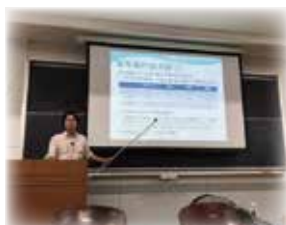
▲国際協力の伝道師として大学などで講演もしています。

法学士、開発学修士、公共経営修士、TOEFL(CBT)257点(TOEIC915点相当)、仏語検定3級、プロジェクトマネジメントスペシャリスト(PMS)、政策学校「一新塾」32期生、ビール検定2級、ふなばし市民大学学校平成26年度ボランティア入門学科